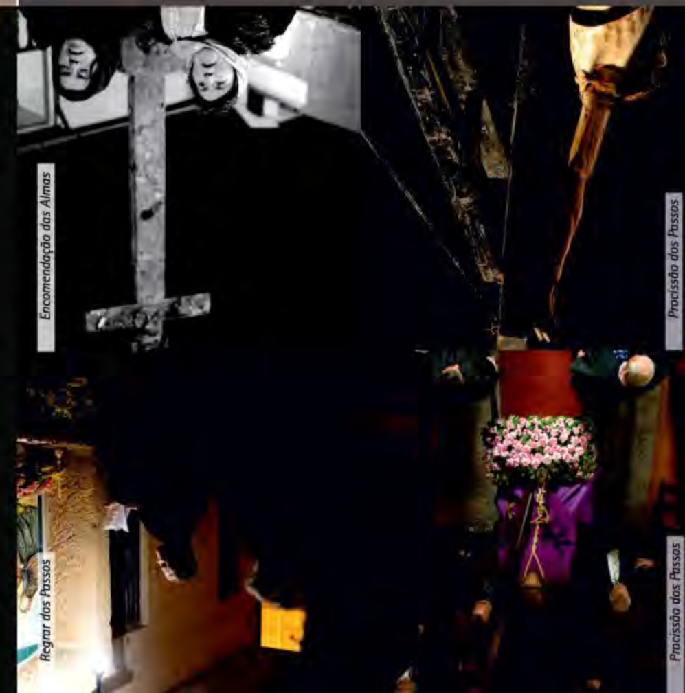
Encomendação das Almas